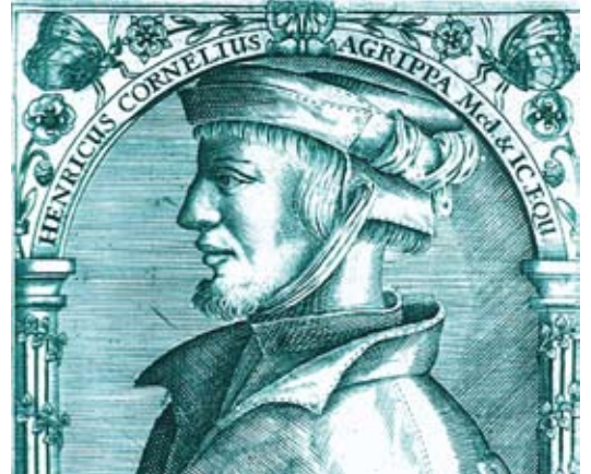
Sopra: Heinrich Cornelius Agrippa (1486-1535)