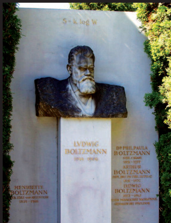
LA TOMBA DI LUDWIG BOLTZMANN A VIENNA (IMMAGINE DI PUBBLICO DOMINIO)